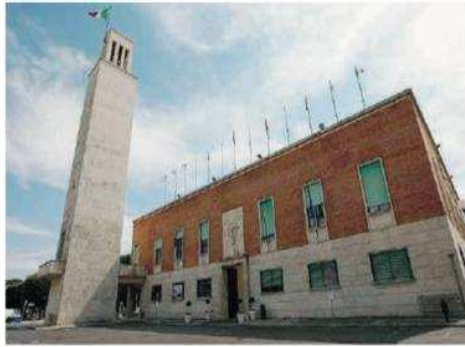
Il palazzo municipale di Sabaudia

getti e di obiettivi da raggiungere per la città partendo dalla cultura e dal sociale. Il percorso della Consulta delle Associazioni inizia a Sabaudia nel 2018 quando viene approvato all'unanimità il regolamento in consiglio comunale. Le adesioni non sono ovviamente chiuse. Come da regolamento possono aderire tutte le associazioni iscritte all'albo comunale nonché le organizzazioni di volontariato con sede operativa nel Comune di Sabaudia, rientranti nei quattro settori indicati: sociale-sanitario; cultura e turismo; ambiente; sport. Sono escluse associazioni, movimenti e organizzazioni aventi finalità di carattere